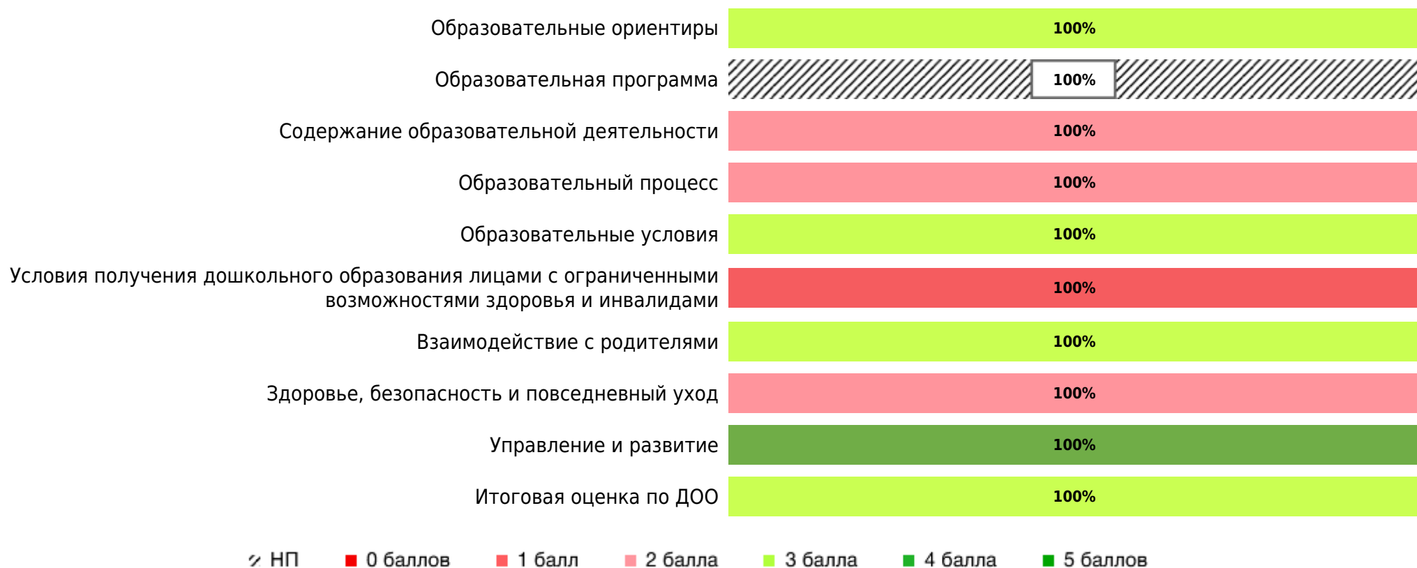
Доли ДОО с разными баллами у их ООП ДО ДОО (самооценка)

В процессе самооценки было оценено 2 ООП ДО ДОО из 1 ДОО субъекта РФ.