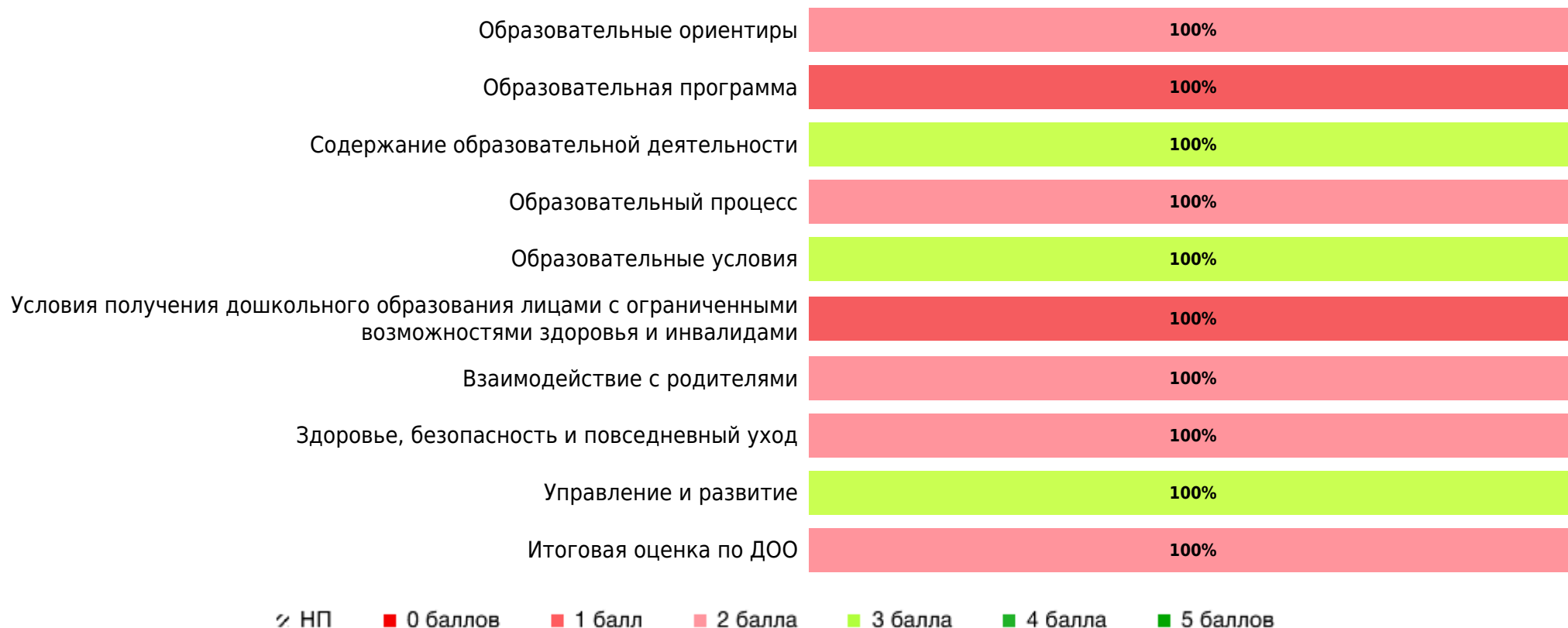
Доли ДОО с разными баллами у педагогов